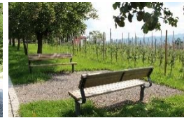
Sitzbänke an Satellitenstandort