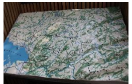
3D Relief Satellitenstandorte