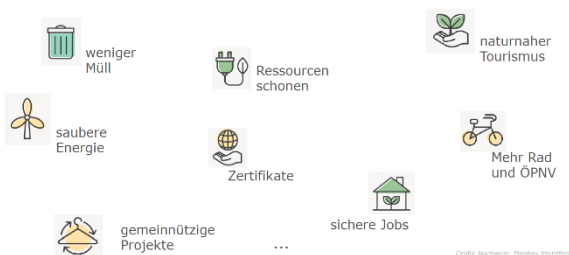
Der Ruf nach Nachhaltigkeit

Informationen zu den Kooperationsprojekten Nachhaltigkeit im Lebensraum Allgäu erleben der Allgäu GmbH und Digitales Wald-Holz-Netzwerk des Holzforum Allgäu e.V. erhalten Sie durch einen Klick auf die Links. Beide Kooperationsprojekte werden federführend durch die Regionalentwicklung Oberallgäu betreut.