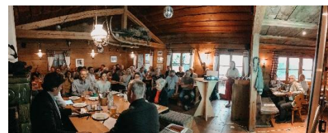
Mitgliederversammlung Oberstaufen Klicken Sie auf die Bilder!