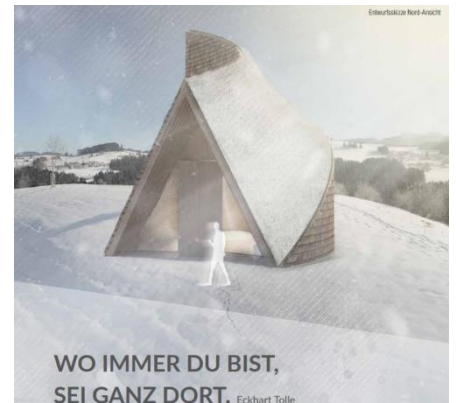
Projekt SinnRaum gehört zum EZ II - Schärfung des Tourismusprofils und Qualitätssteigerung der Angebote

Erfreuliches gibt es vom Projekt „Freilichttheater „Der 30jährige Krieg im Allgäu und in Vorarlberg““ zu berichten. An sechs Abenden im Juni wurde das Stück dank der ca. 100 Ehrenamtlichen vor und hinter der Bühne zu einem zeitgeschichtlichen Spektakel für insgesamt 1.700 Besucher. Der Kirchplatz des Markt Weiler-Simmerberg eignete sich optimal für die Aufführung. Die darstellerische Leistung überzeugte das Publikum, was sich mit Lob nicht zurückhielt. Neben des didaktischen Ansatzes, den Besuchern des Theaterstückes zeitgeschichtliche Ereignisse nahe zu bringen und etwas über die Geschichte in ihrer Region zu lehren, lebt das Theaterstück weiter und wird den Schulen als Lehrmaterial kostenfrei zur Verfügung gestellt.