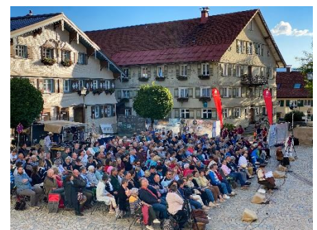
Mehr Bilder der Aufführung „Der 30jährige Krieg im Allgäu und in Vorarlberg“ gewünscht?